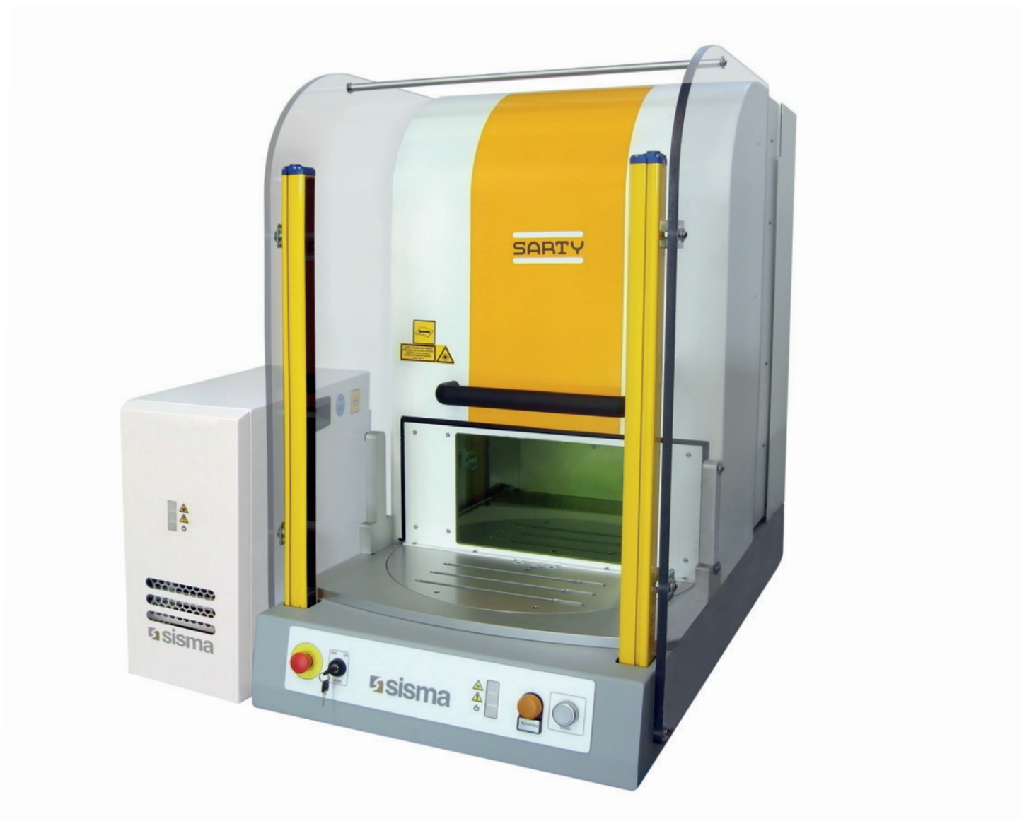
Laser marking and engraving system. Sistema di marcatura e incisione laser.